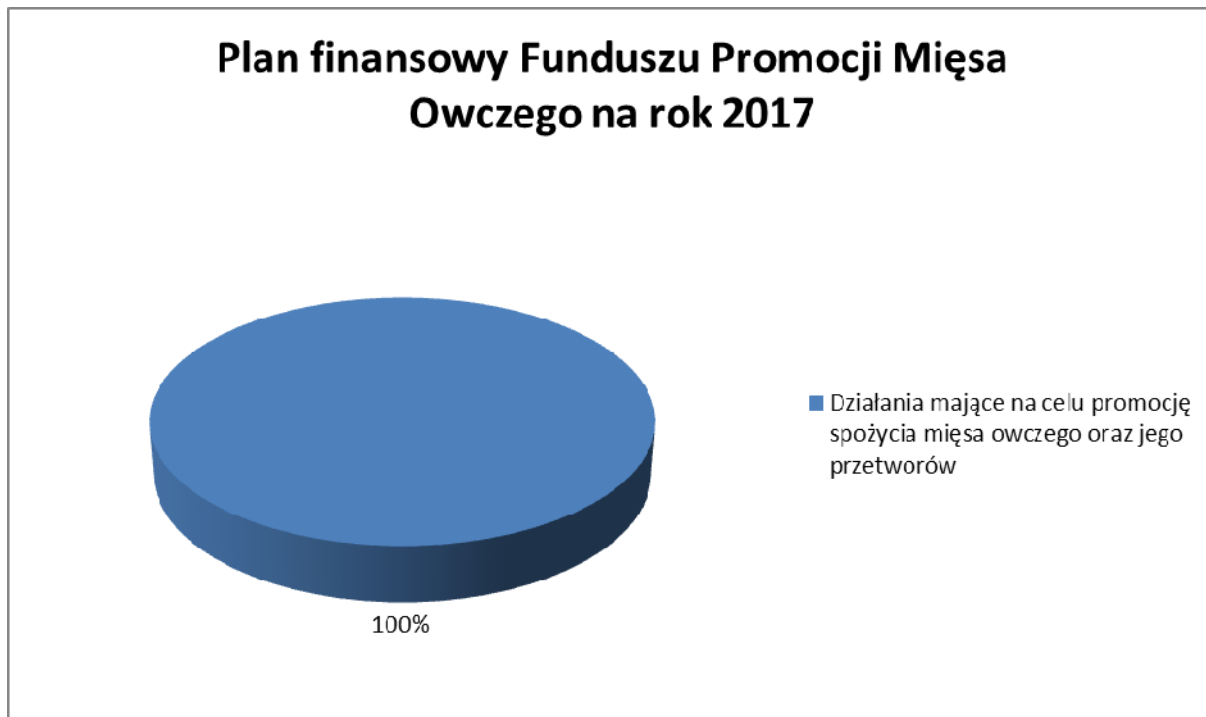
Wykres nr 3. Struktura planu finansowego FPMO na rok 2017.

W planie finansowym FPMO na rok 2017 na zadania zgodne z celami funduszu promocji mięsa owczego przeznaczono kwotę 15 000,00 PLN .